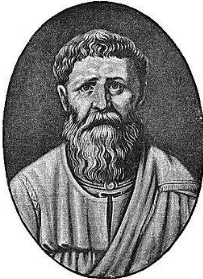
Augustinus van Hippo